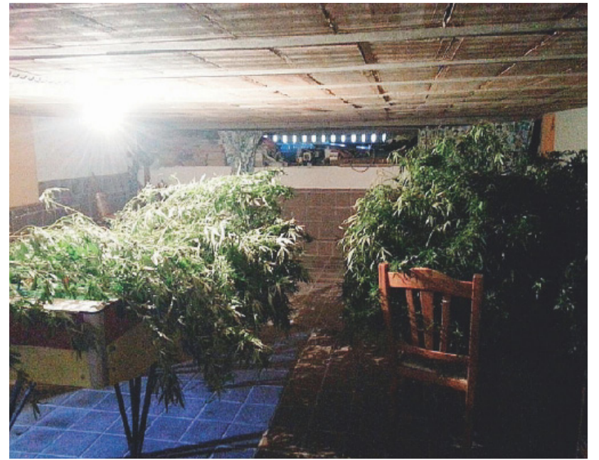
LA DROGA Le piante di marijuana sequestrate

L'uomo, in seguito a una perquisizione domiciliare, è stato trovato in possesso di 8 piante di